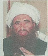
Jalaludin Haqqani Leader tribale filo talebano. Si nasconderebbe in Waziristan