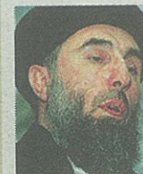
Gulbudin Hekmatyar Signore della guerra filo talebano e alleato di Osama