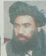
Mullah Dadullah Comandante zoppo talebano, abile nelle operazioni militari