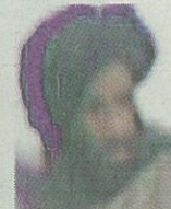
Mullah Omar Ex leader dell'Afghanistan, guida spirituale dei talebani